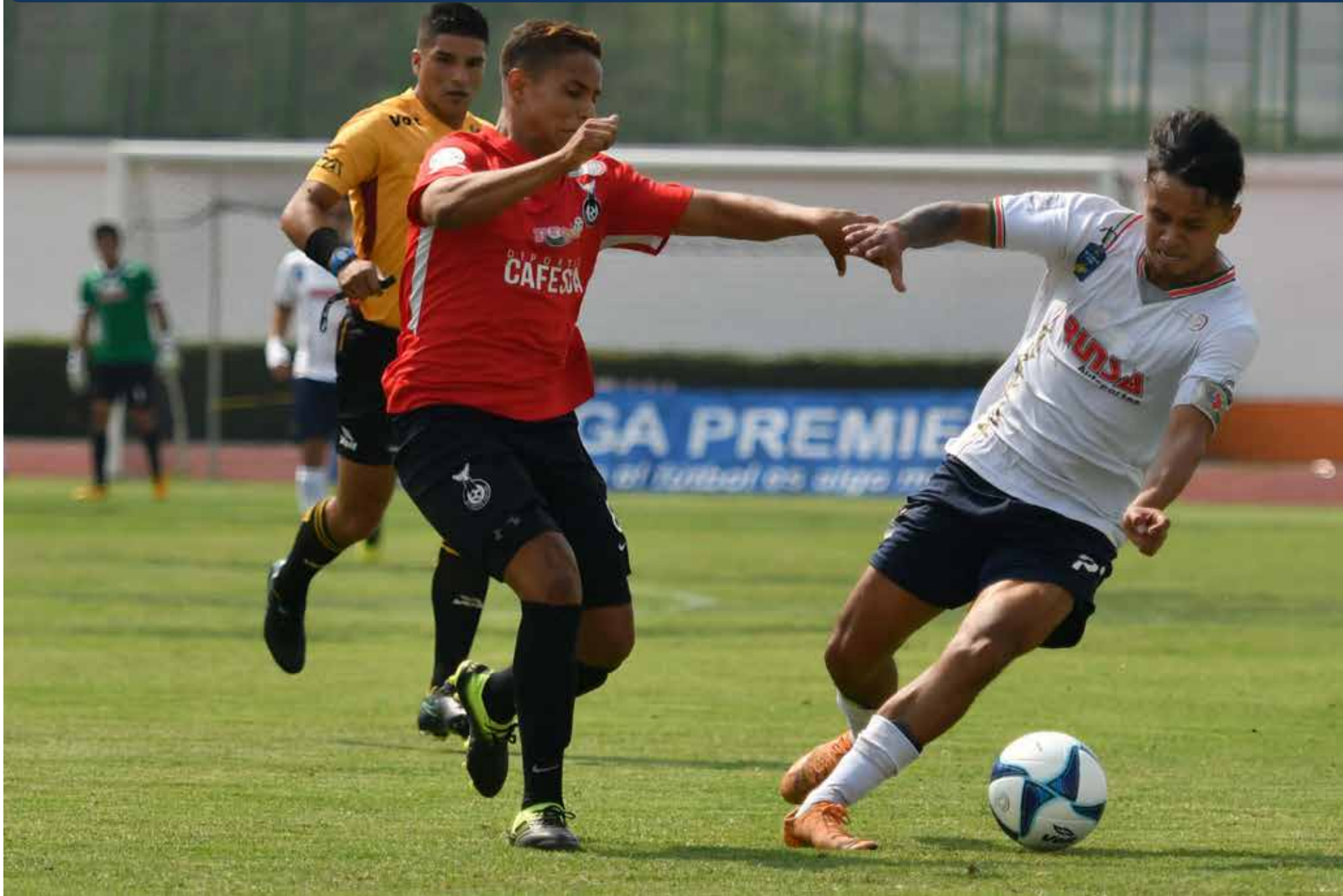
TABLA DE POSICIONES LIGUILLA