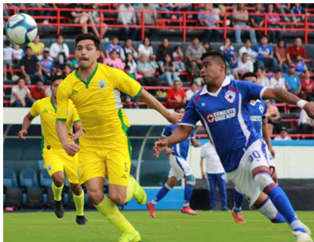
La UAZ y Loros de Colima toman ventaja