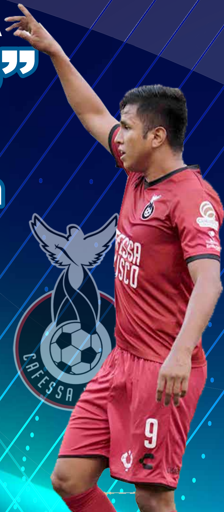
TABLA DE GOLEO SERIE A