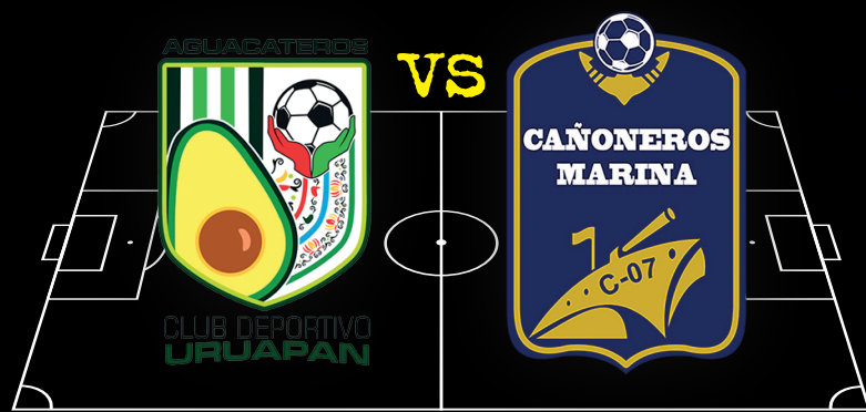
Aguacateros Club Deportivo Uruapan vs Cañoneros Marina