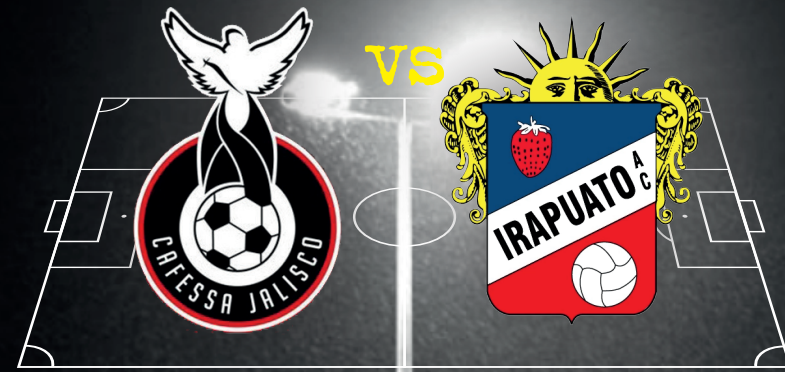
CAFESSA Jalisco vs Club Irapuato