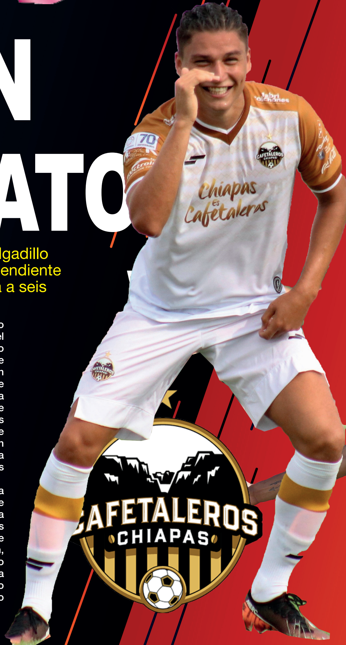
TABLA DE GOLEADORES