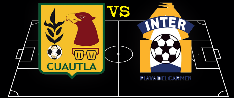
Cuautla vs Inter Playa del Carmen