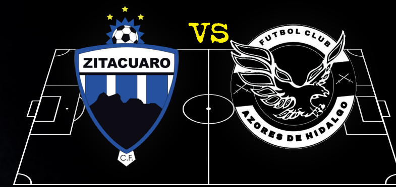
Club Deportivo de Futbol Zitácuaro vs Azores de Hidalgo