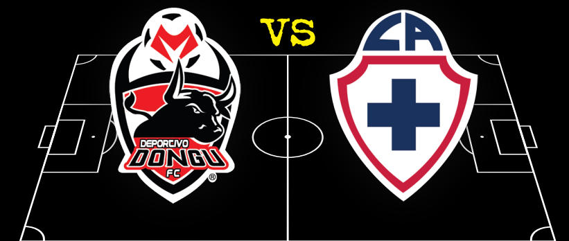
Deportivo Dongu vs Cruz Azul Hidalgo

CIUDAD: Cuautitlán, Estado de México ESTADIO: Municipal Los Pinos