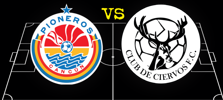
Pioneros de Cancún vs Club de Ciervos

CIUDAD: Cuautla, Morelos ESTADIO: Isidro Gil Tapia DÍA: Domingo 15 de octubre 2020 HORA: 16:00 horas