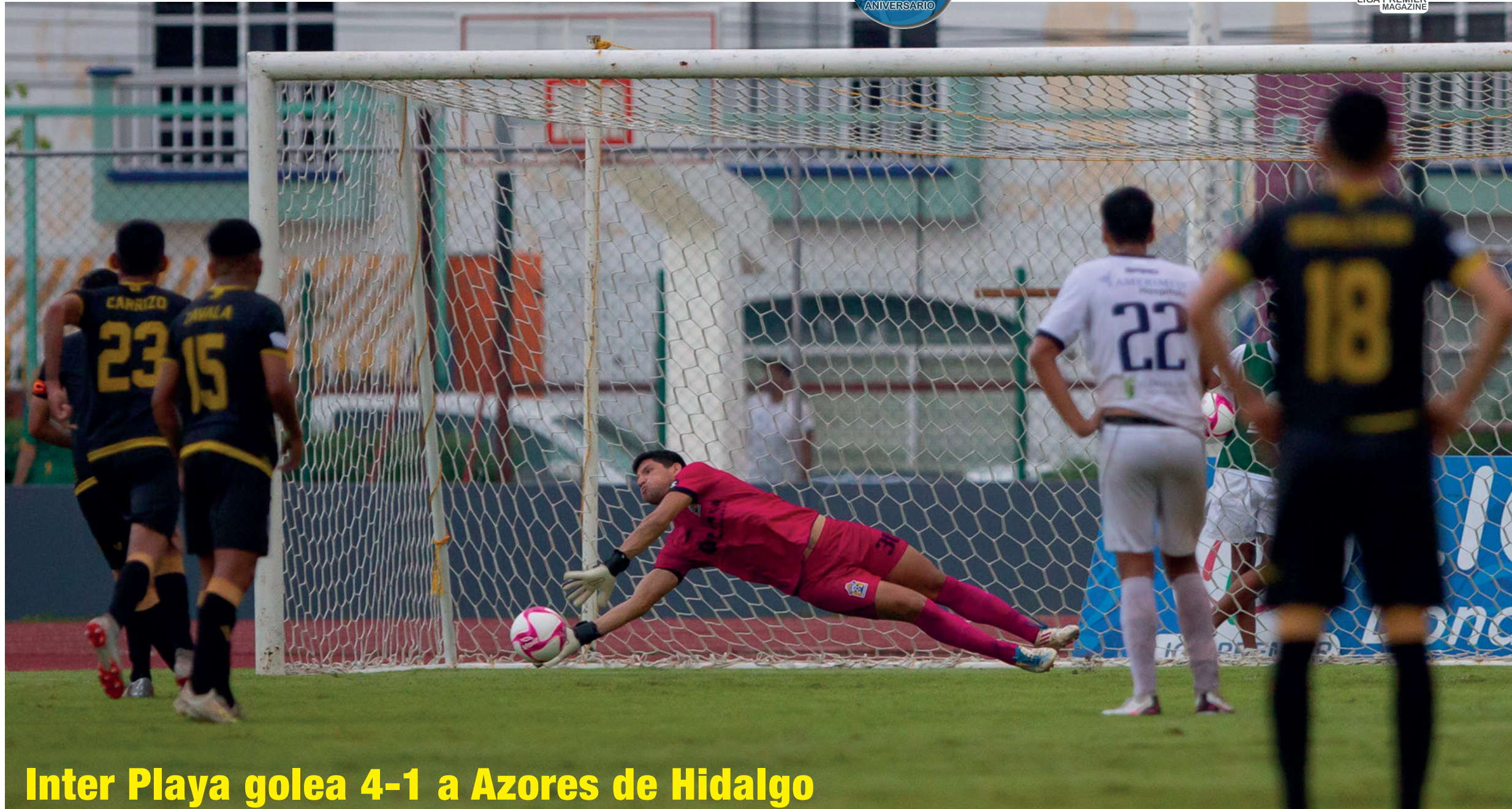
Inter Playa golea 4-1 a Azores de Hidalgo