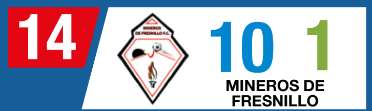
TABLA SERIE A G-1