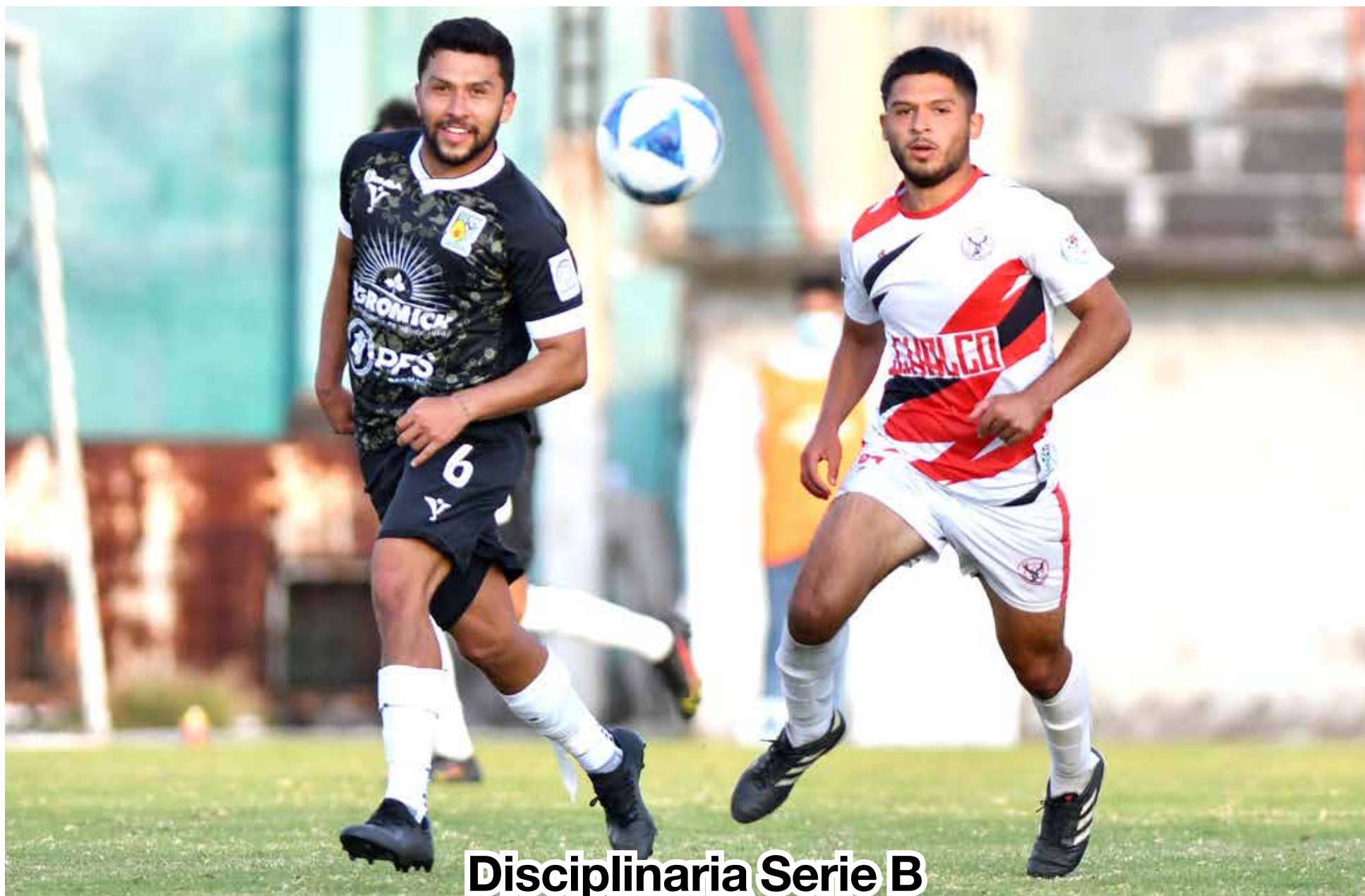
Disciplinaria Serie B