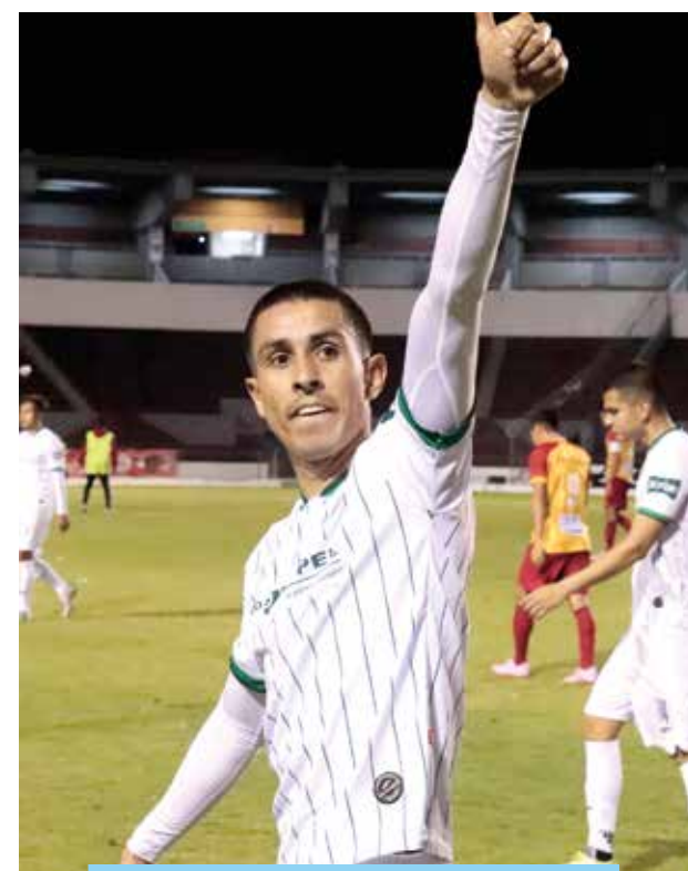
FIGURA DEL PARTIDO

para Tecos, además de recibir ya 11 goles.