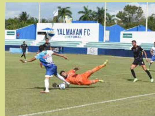
FIGURA DEL PARTIDO

para Yalmakan FC para perder lo invicto, se quedó en 12 puntos y lo peor es que en la próxima jornada deberá visitar a Cafetaleros de Chiapas en lo que será un duelo entre la mejor defensiva contra la ofensiva más productiva.