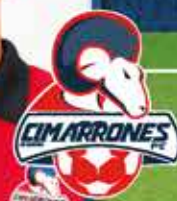
84 - BRYANT ALEXIS NAVARRO