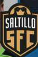
15 - SERGIO VÁZQUEZ