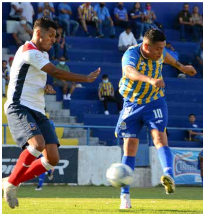
FIGURA DEL PARTIDO

Un partido correspondiente a la J7 del Clausura 2022 donde los michoacanos dieron muestra de que pueden ser un