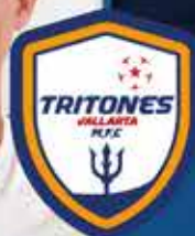
4 - SEBASTIÁN MADRID