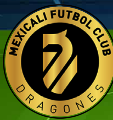
Mexicali Futbol Club