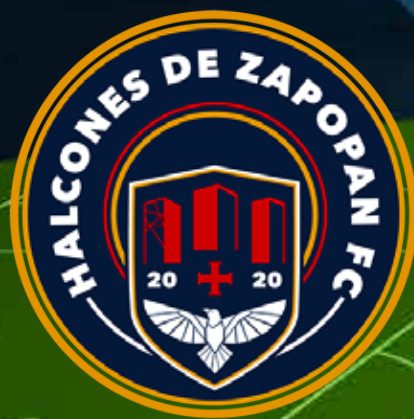
Halcones de Zapopan