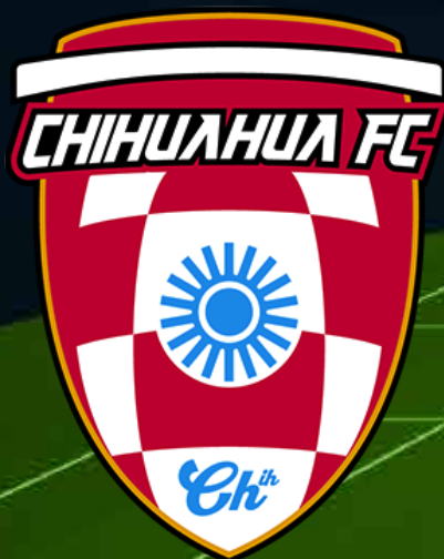
Chihuahua Futbol Club

Con la llegada de estos Clubes a la Liga Premier, la competencia en la Serie A incrementará su nivel y emociones, sin la menor de las dudas.