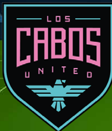
Los Cabos United