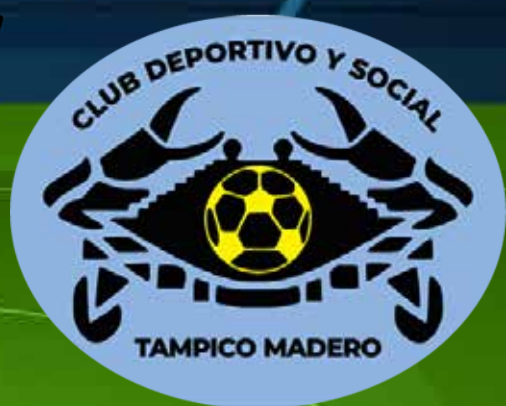
CD y Social Tampico Madero Sede Tampico, Tamaulipas