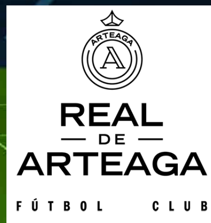
Real de Arteaga FC Sede Querétaro, Querétaro